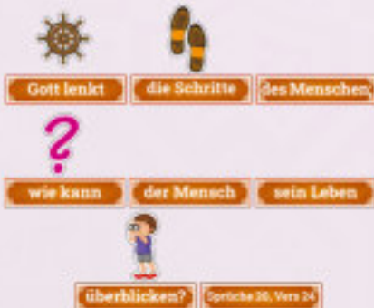
Vorlagen für die Bibelverse zum Lernen