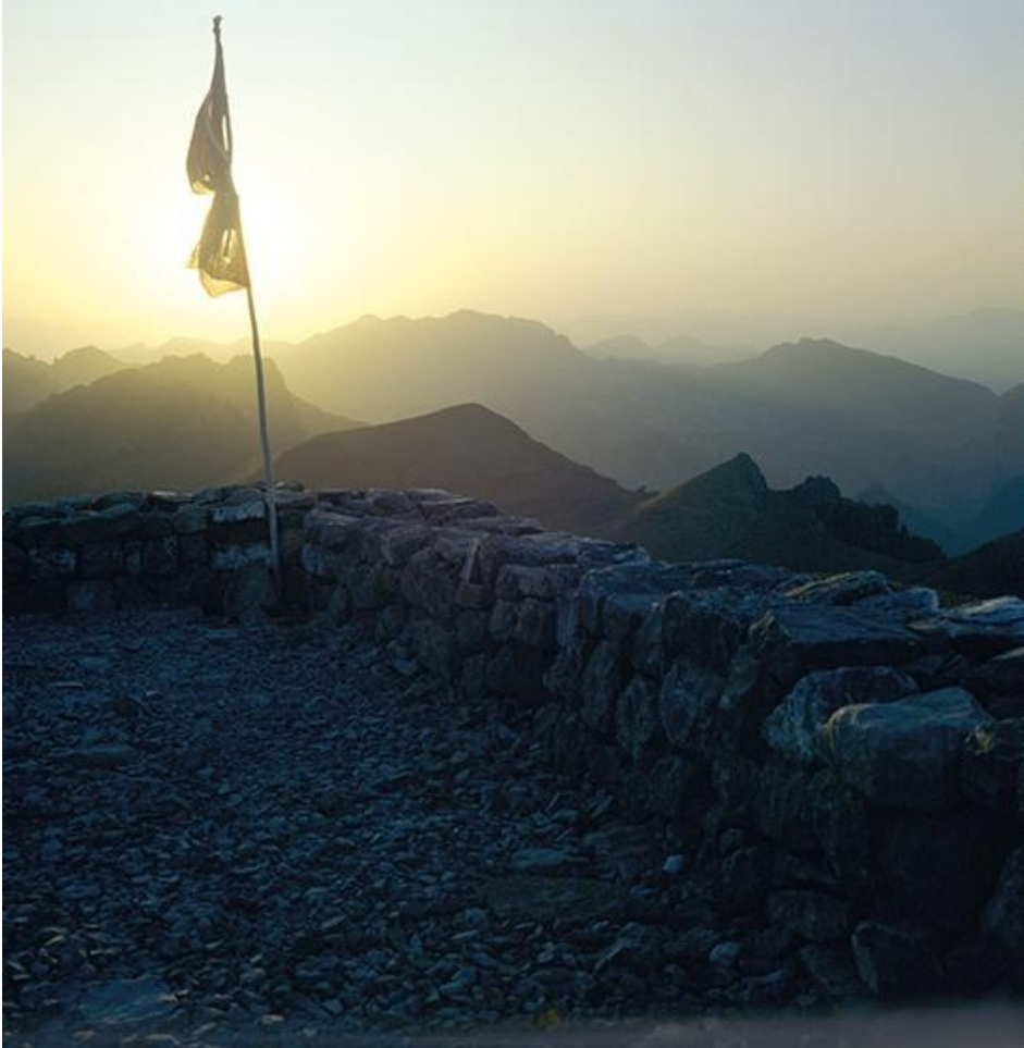
Der Landeplatz der Arche bei Sonnenaufgang, 1983

Sehen Sie mehr Bilder in der vollständigen Ausgabe!