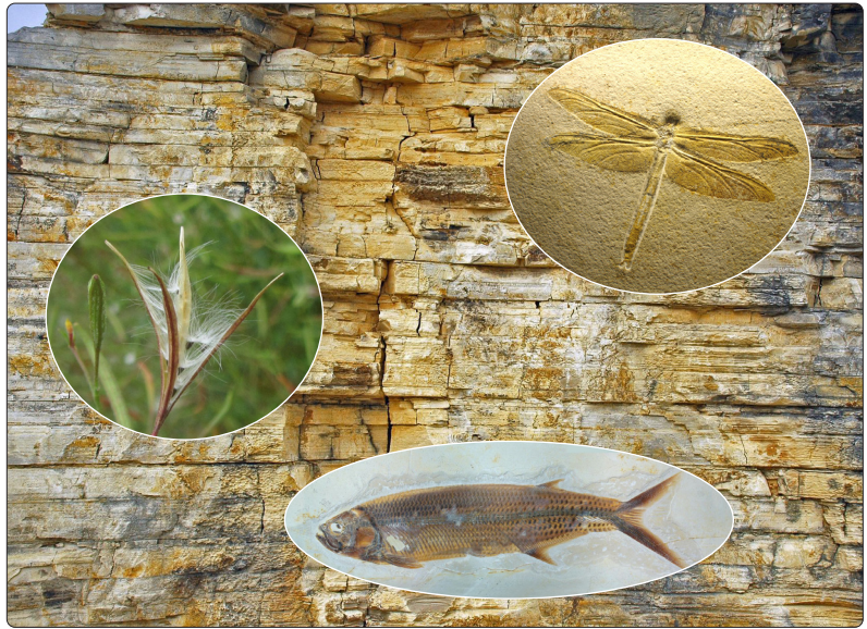
Abb. 1-2 Naturwissenschaftler arbeiten empirisch, d. h. sie untersuchen die belebte und unbelebte Natur durch Beobachtung und Experiment. Die Vergangenheit ist nur indirekt erschließbar. Denn die Prozesse, die zum Beispiel zur Bildung von Schichtgesteinen oder zur Entstehung von Fossilien geführt haben, können nicht beobachtet werden. Naturwissenschaftler versuchen, die vergangenen Prozesse so zu rekonstruieren, dass die mutmaßlichen Szenarien durch die Beobachtungen unterstützt werden und ihnen nicht widersprechen.

Empirische Daten: Beobachtungen in der Natur, im Freiland oder im Labor.